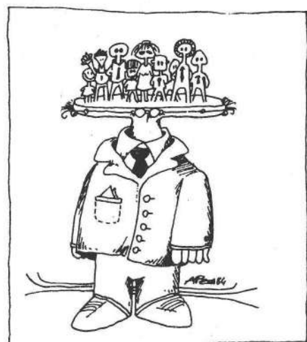
PSICOLOGIA E SOCIETA'